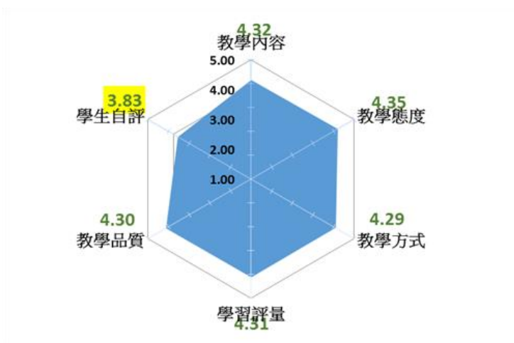
圖四、教學評量之雷達圖分析